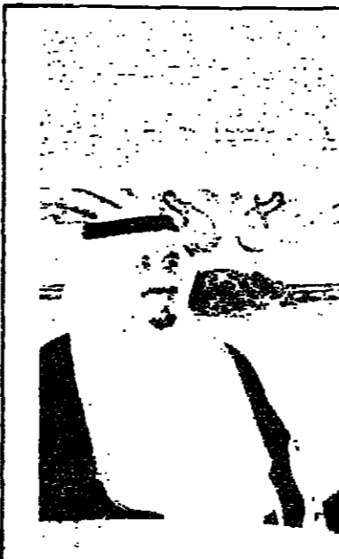
عند المرقع اول عبد الغني

دعت مسيرة شعبية ضخمة اشترك فيها حوالي ١٢٠ الف شخص في بورسعيد امس ، احتفالات اعادة فتح قناة السويس في وجه الاحصنة الدولية اليوم ، بعد ان ظلت مغلقة طوال ثمانية ايام . وتقيم المسيرة الساعة : الدكتور زعت الحبيب الابن الاول للجنبة المركزية ، والمهندس عثمان احمد عثمان وزير التعمير والاسكان ، وعبد حمود وزير الدولة للحكم المحلي ، ووزير الري محمد حسان ، ووزير الزراعة محمد امين ، والاتحاد الاشتراكي بالحفاظ ، وشاركت في المسيرة جميع الهيئات المهنية والحرفية والتنظيم النسائي والشباب ورجال الدفاع الشعبي وطلبة وطالبات المدارس والمعالي والمدارس المتقدمة مواكب الزهور والموسيقى في حنيقة سعد زغلول ، مخترقة شوارع المدينة الى ميدان الشهداء امام مبنى المحافظة . وتقدرا لشهداء المدينة المنسلية العسكريين والجنود في استعادة قناة السويس ، وضعت المسيرة الشعبية اكاليل الزهور على النصب التذكاري لشهداء اقام وسط الميدان .